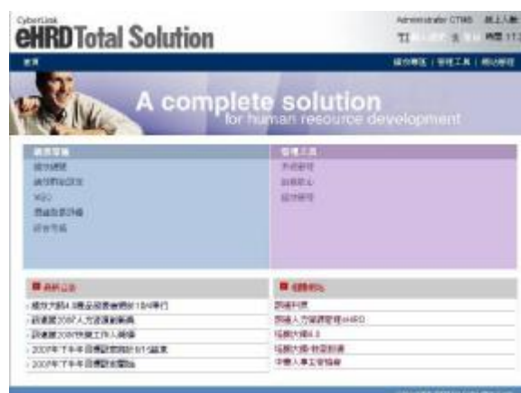
圖片說明：簡潔流暢的使用者介面

「績效大師 4」標準版是訊連科技針對企業績效評估管理，所精心研發的 e 化系統，不需繁複的 IT 整合，簡單幾步驟的系統安裝、直覺式操作介面，企業可輕鬆快速導入績效評估管理系統，讓企業策略目標與員工工作目標相結合，確保企業與員工發展目標一致，提升企業營運績效。